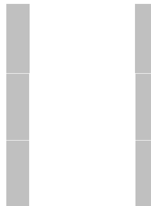
表 12 教学进程总体安排表（每学期 20 周具体安排详见附表 1）